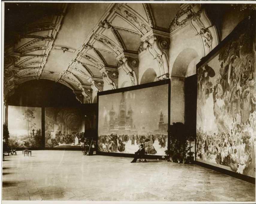
Zdroj: Mucha s vystavenými plátny v Klementinu. 1919.